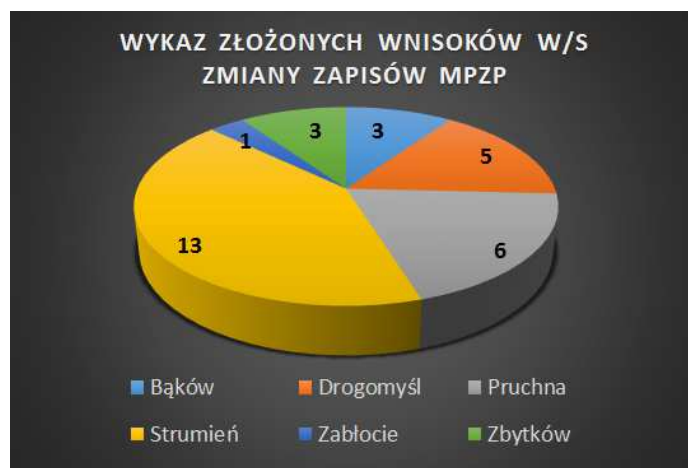
Tabela nr 29, Wykres nr 4. Zestawienie wniosków w/s zmiany zapisów mpzp