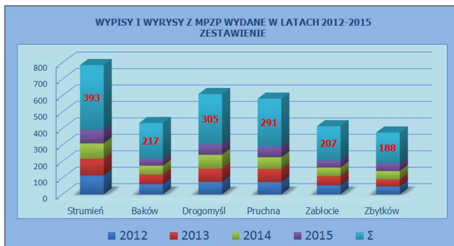
Wykres nr 2. Zestawienie wypisów i wyrysów wydanych w latach 2012-2015