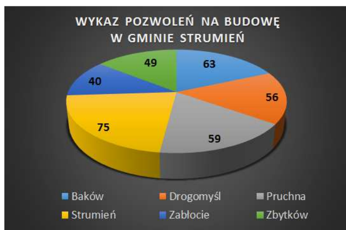
Wykres nr 1. Zestawienie pozwoleń na budowę wydanych na terenie Gminy Strumień w latach 2012-2015