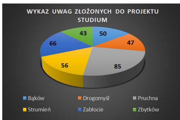
Wykres nr 3. Zestawienie uwag złożonych do projektu studium

W analizowanym okresie tj. w latach 2011 – 2015 do Burmistrza Strumienia wpłynęło 31 wniosków w sprawie zmiany przeznaczenia nieruchomości w miejscowym planie zagospodarowania przestrzennego (w analizie nie uwzględniono wniosków do aktualnie sporządzanych planów).